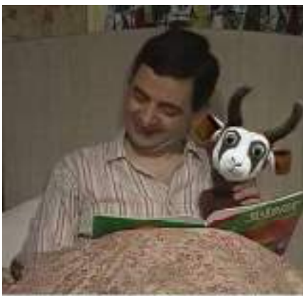
And then the big bad Bok ate all of them! The end.